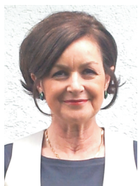
Monika Sauer GbR

Individuelle Terminvereinbarungen, z. B. auch für Freundinnen, sind möglich!